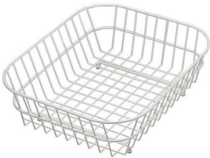
不锈钢篮 8612 000