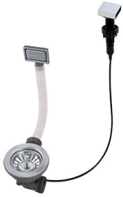
自动下水 8407 113